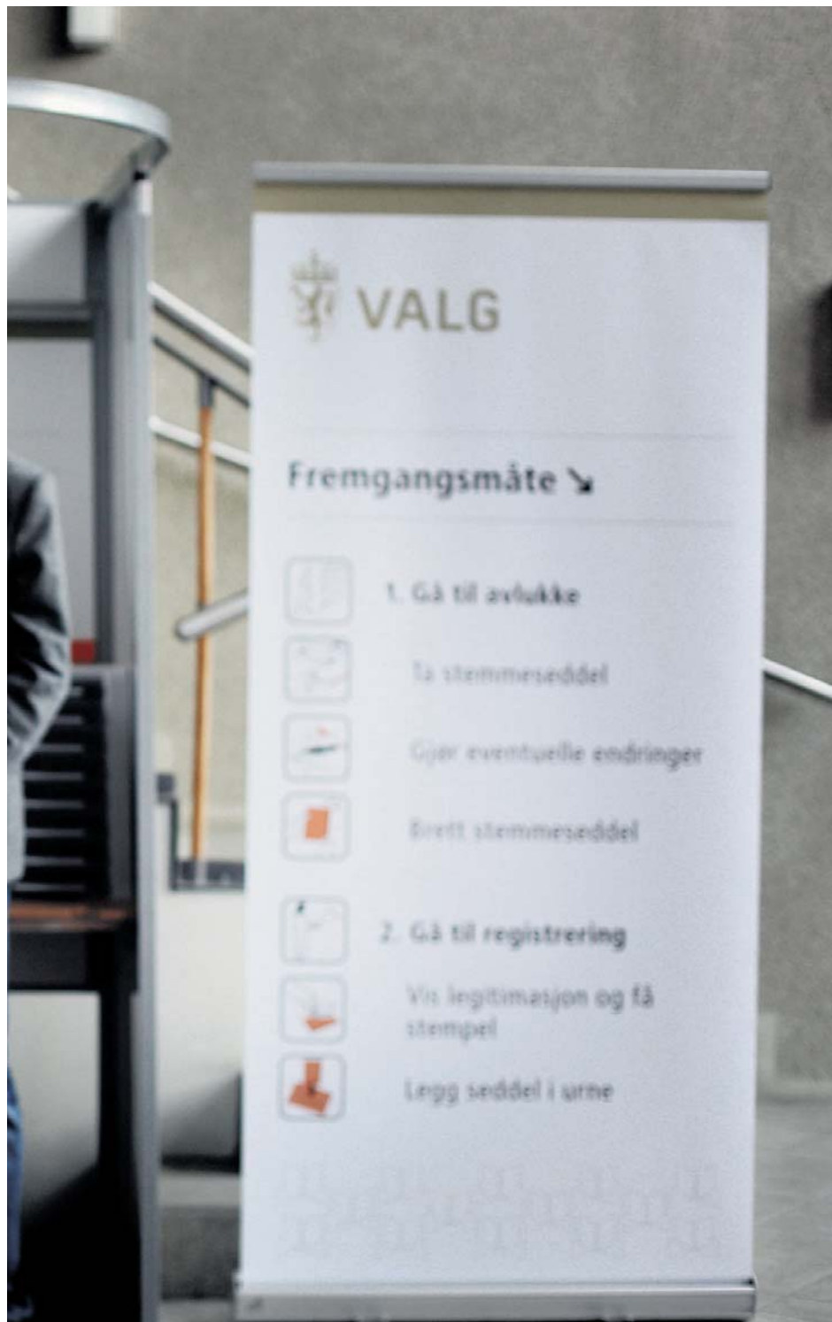
eller spesielle behov, mener juryen som

Tekst: Grete Holstad grete.holstad@adresseavisen.no